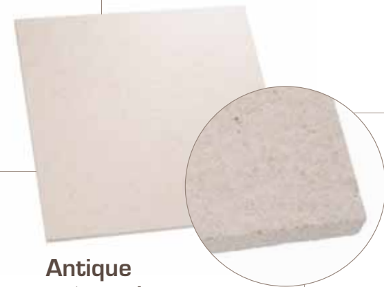
Antique arêtes vives