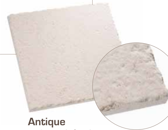
Antique arêtes éclatées