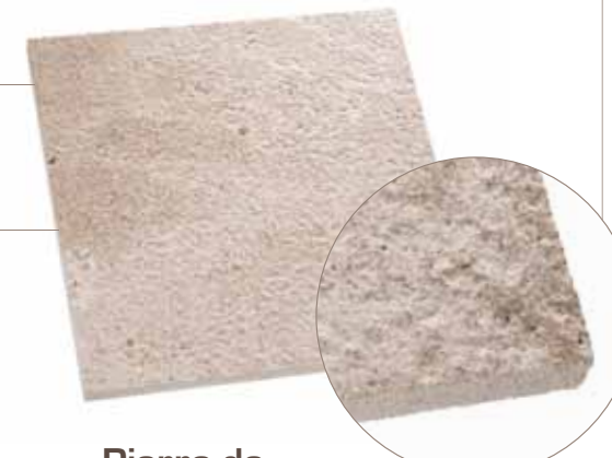
Pierre de Semond jaune brossée métal