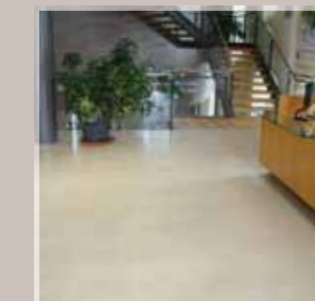
Théâtre - Angoulême