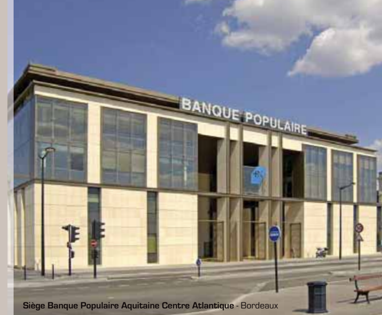
Siège Banque Populaire Aquitaine Centre Atlantique - Bordeaux