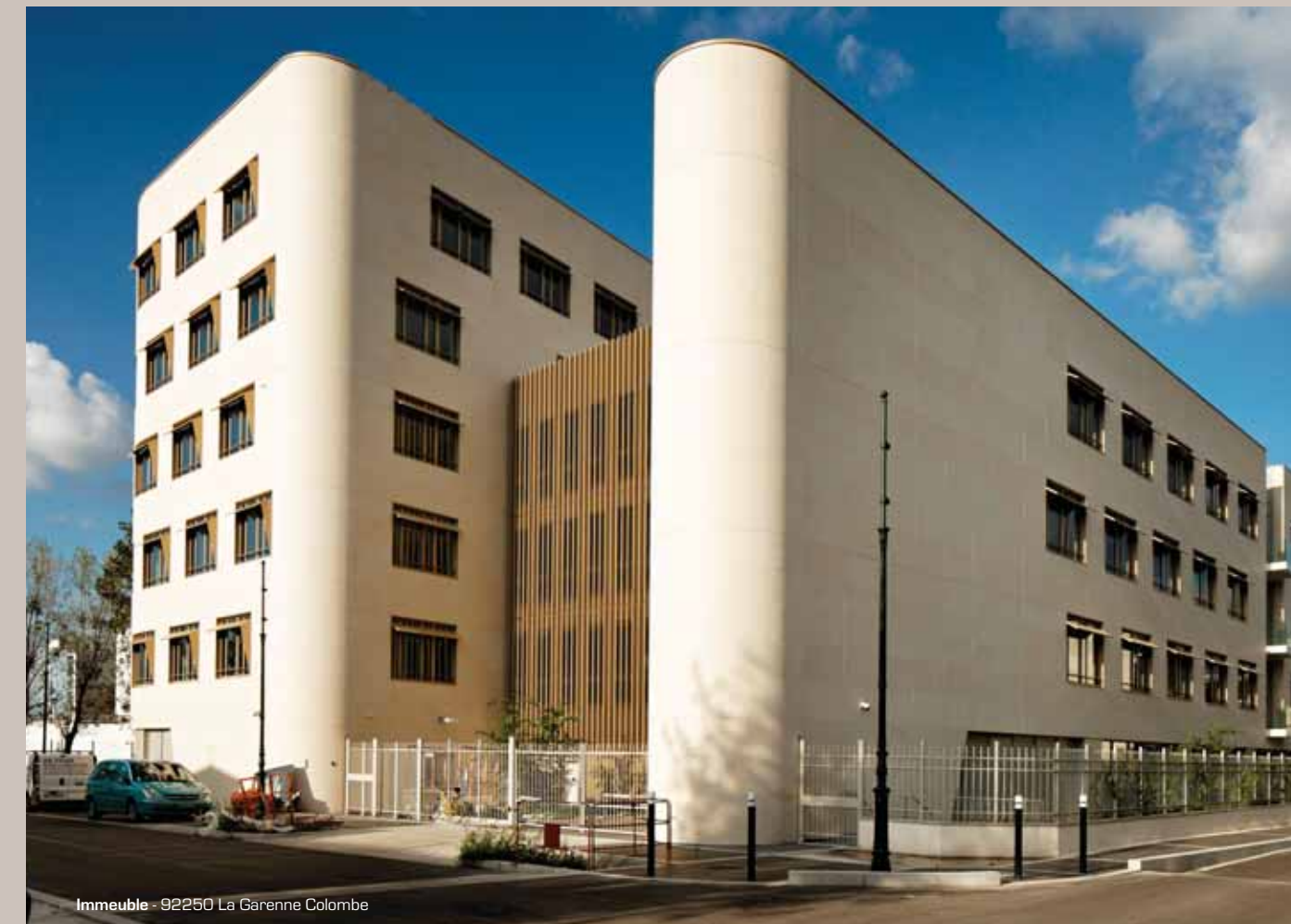
Immeuble - 92250 La Garenne Colombe