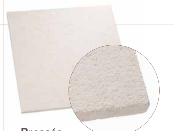
Brossée métal arêtes vives