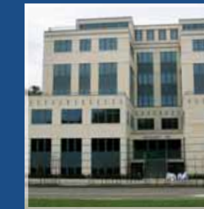
Immeuble - Evere Belgique