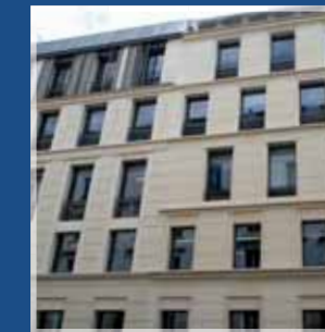
Immeuble - 75009 Paris