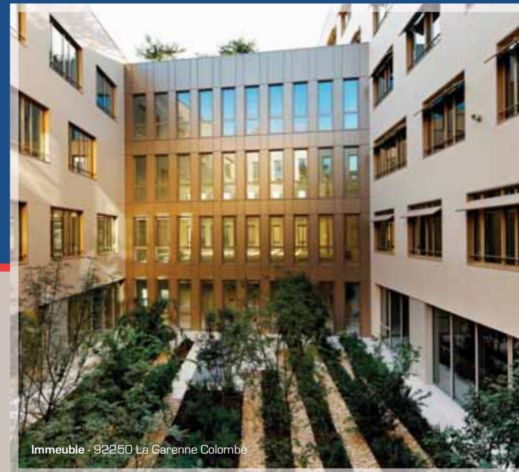
Immeuble - 92250 La Garenne Colombe