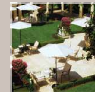
Hôtel 5* Le Bristol - 75008 Paris